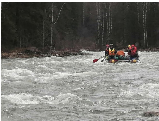
Фото 3. Выход из шиверы Кабан-Таш.